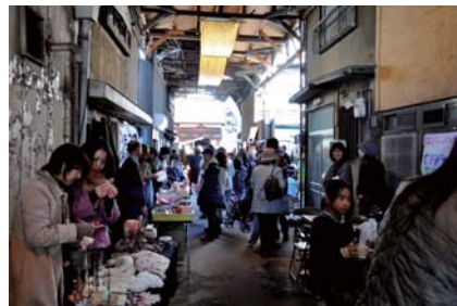
▲かつての商店街アーケード。レトロな魅力を醸す一方、老朽化によるリスクも。

今や少子高齢化は中山間地域だけの問題ではない。中心市街地に隣接する松本町は、かつて花街として栄え、戦後は松應寺を中心に商店街がにぎわっていたが、今では高齢化が進み、境内に形成された“松應寺横丁”内の建物の半数が空き家となっていた。こうした高齢化・空洞化の進行に危機意識を持った町内会、松應寺住職、そして岡崎まち育てセンター・れた職員らが出会い、この状況を何とかしようと2011年7月に「松應寺横丁にぎわいプロジェクト（現・松應寺横丁まちづくり協議会）」を発足させた。