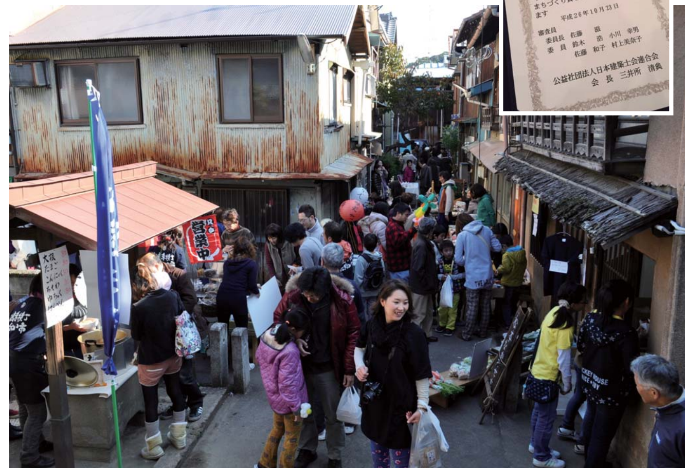
▲まち協主催「松應寺横丁にぎわい市」。活気にあふれ、多様な世代の交流の場になっている。