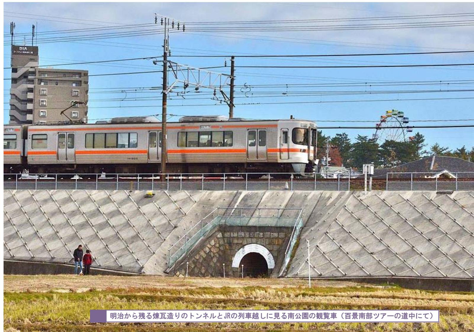
明治から残る煉瓦造りのトンネルとJRの列車越しに見る南公園の観覧車(百景南部ツアーの道中にて)