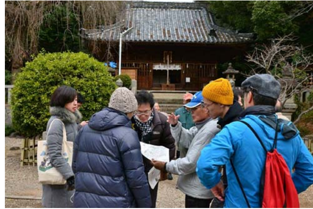
▲百景にまつわる逸話からこの地域の歴史まで話が弾みます