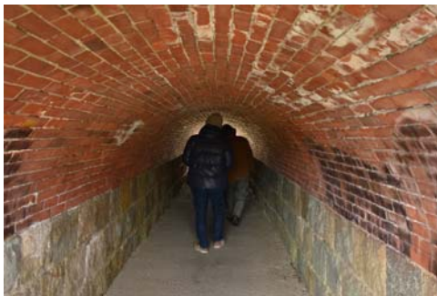
▲表紙の煉瓦のトンネルは地元では「マルガタ」と呼ばれる(岡崎まちなものがたり「岡崎学区」P4参照)

今回は2コースのみですが、今後新たなコースも増やしていきたいと考えていますので、乞うご期待！